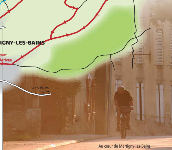
Au cœur de Martigny-les-Bains

Anciennement Martigny les Lamarche, Martigny les Bains est une commune située à la pointe occidentale du département des Vosges. De la station thermale réputée au début du siècle, il ne reste que le Pavillon des Sources (réhabilité en 2001) et un adorable parc thermal pour témoigner du passé florissant de la station. A l'aplomb des grandes verrières du pavillon des Sources, un parc à l'anglaise nous dévoile ses arbres remarquables, son arboretum. Cet espace naturel de 7 ha, agencé autour d'un plan d'eau, d'îles et de ruisseau, de ponts et de passerelles, de kiosques et de pavillons est l'un des plus beau parc public des Vosges !